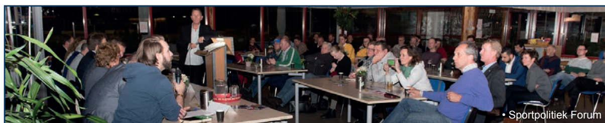
• Sportpolitiek Forum

Naar aanleiding van de 1e stelling onderschreven vrijwel alle aanwezige politici dat sport juist in clubverband verbreedert en verbindt, daar moeten die mensen en vooral ook jongeren naar toe, naar de clubs. Daar ontmoeten de diverse bevolkingsgroepen elkaar. Sportclubs zijn op zichzelf al maatschappelijk actief en daarom moet de gemeente clubs in voldoende mate ondersteunen. Wat betreft de 2e stelling werd door veel van de forumleden gewezen op de geplande bouw van veel huizen binnen Delft, waardoor het inwonertal aanzienlijk zal gaan stijgen. Daarmee zijn extra sportvoorzieningen nodig, terwijl er nu al onvoldoende capaciteit is. Het gaat dan niet alleen om meer geld voor de noodzakelijke investeringen, maar ook om het vinden van de daadwerkelijke fysieke ruimte voor de sportaccommodaties. Vanwege het belang van sport voor andere beleidsdoelen moet het geld ook uit andere beleidsgebieden komen, zo spraken een aantal van de politici uit.