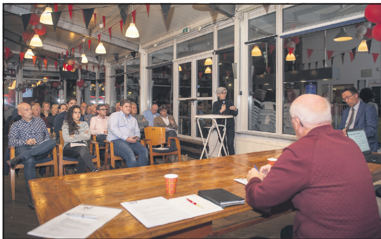
Een vol huis bij de ALV van de Sportraad Delft

De eerste lijn (de Investeringsagenda) beoogt het systematisch maken en realiseren van plannen voor het minimaal op orde brengen van de binnen- en buitensportaccommodaties in Delft, terwijl de tweede lijn (het Uitvoeringsplan) beoogt om ook daadwerkelijk invulling en ondersteuning te geven aan de sportactiviteiten door en bij de sportclubs in Delft. Uiteraard is er op accommodatiegebied een bijna onbeperkte wensenlijst aan de ene kant, maar aan de andere kant een beperking door wat realistisch mogelijk is in geld en dat