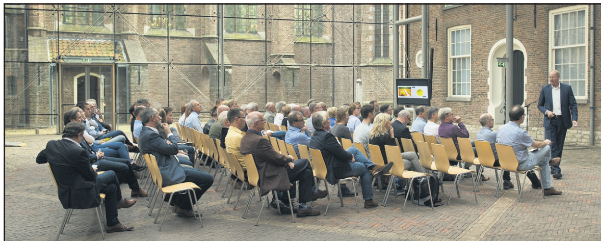
De eerste bijeenkomst van het Delftse Sportcongres

Het grote succes van de 1e editie van het Delftse Sportcongres, een jaar geleden, heeft het Bestuur van de Sportraad Delft doen besluiten om dit jaar het 'Tweede Delftse Sportcongres' te organiseren.