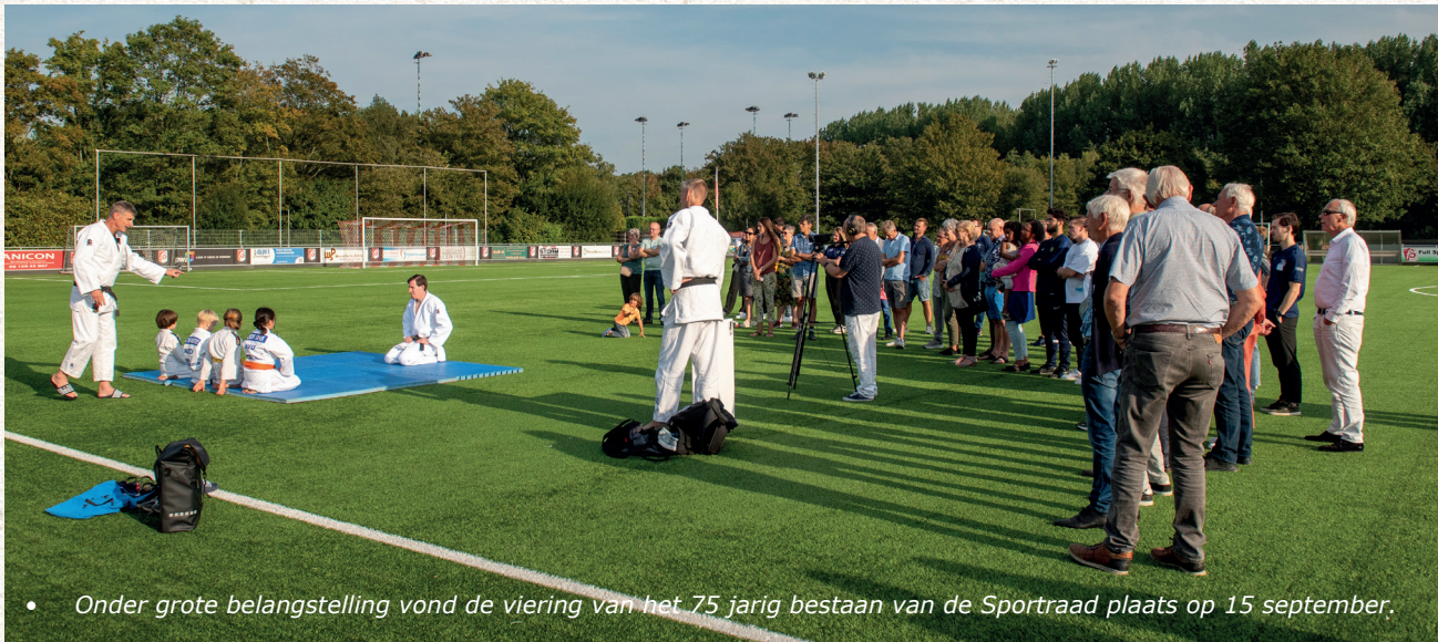
• Onder grote belangstelling vond de viering van het 75 jarig bestaan van de Sportraad plaats op 15 september.